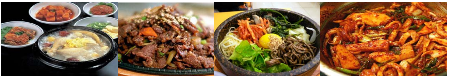
(อาทิเช่น บิบิมพับ หมูไฟบลูโลก โอซั่มหมูปลาหมึก ไก่ตุ๋นโซมเกาหลี BBQ ปิ้งย่าง ไม่อั้น)